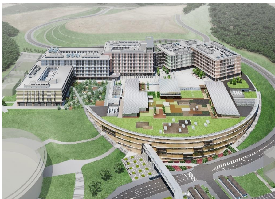
文系4学部副専攻プログラムが展開される伊都キャンパス・イーストゾーン完成予定図

プログラムの詳細は順次専用 Web(各学部 HP よりリンク)にて公開していきます